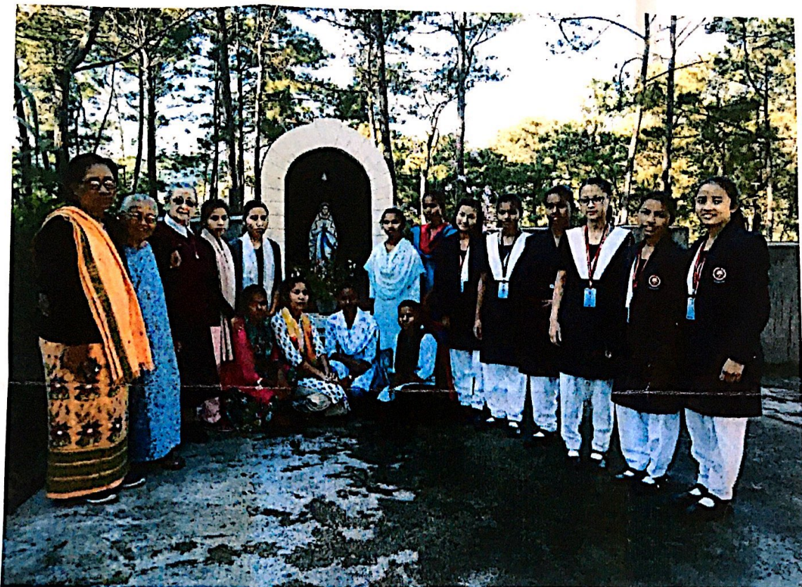
Las 14 candidatas junto a las hermanas indias y yo misma.