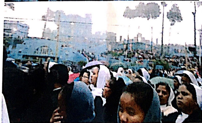
Misa y procesión del Corpus Christi como celebración de final de las lluvias monzónicas.